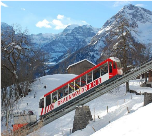
1. Schritt: Verlad der Werkzeuge vom Geschäftsfahrzeug in den Frachtcontainer der Standseilbahn