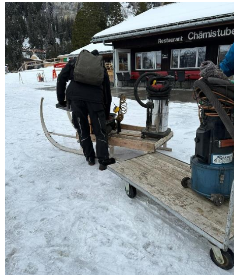
5. Schritt: Verlad der Werkzeuge vom Transportwagen auf einem Schlitten