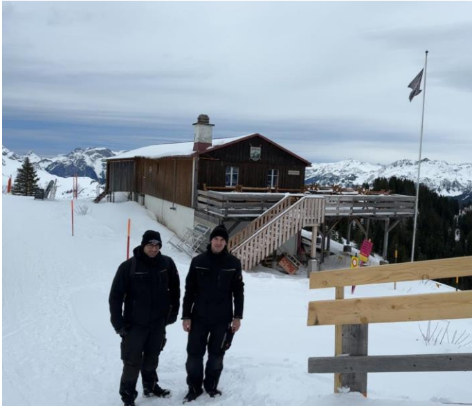
Schritt 7: Oben angekommen alles zur Seblengrathütte (1897MüM) tragen und nachher immer noch lächeln können...