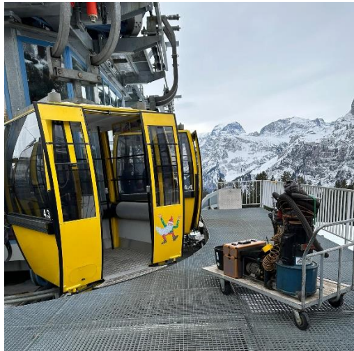
3. Schritt: Verlad der Werkzeuge vom Kawasaki in die Gondelbahn zum Grotzenbühl und