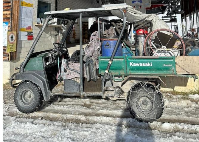
2. Schritt: Verlad der Werkzeuge auf einem offenen wintertauglichen Kawasaki